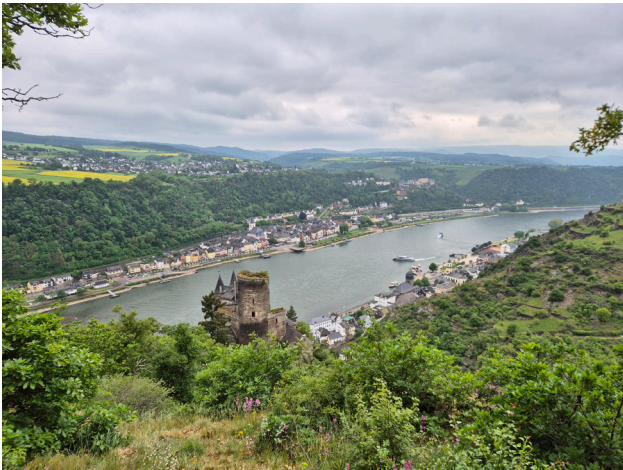
Klassenfahrt nach Oberwesel

Liebe Schulgemeinschaft, ich freue mich, dass alle Klassen- und Kurse, die unterwegs waren, wieder wohlbehalten zurückgekommen sind und bedanke mich herzlich bei allen Kolleginnen und Kollegen, die sie begleiteten. Ein paar Fotos aus Nah und Fern erreichten mich in der vergangenen Woche, die ich hier gerne teile.