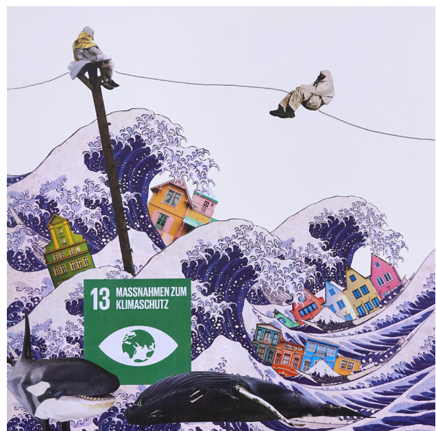
Zwei der 17 Collagen, die im WBZ ausgestellt werden