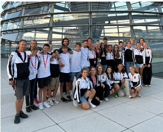
MWS und Willigis in Berlin für JtFO

Liebe Schülerinnen, liebe Eltern, in dieser Woche sollten wir alle unseren Sportlerinnen in Berlin die Daumen drücken. Bis zum Donnerstag sind die Ruderinnen und Schwimmerinnen der MWS bei Jugend trainiert in Berlin sportlich aktiv.