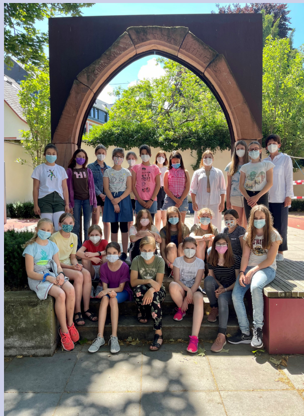
Preisträgerinnen des Fremdsprachenwettbewerbs