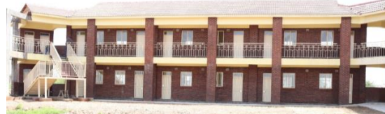
MARY WARD HIGH SCHOOL, 2. BA, Vorderseite nach dem 3. Bauabschnitt ca. 720 Schulplätze