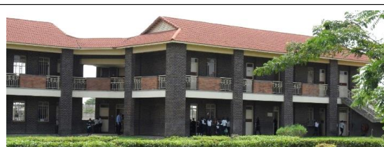
MARY WARD PRIMARY SCHOOL – seit 2000 Teilansicht – ca. 1.000 Schülerinnen/Schüler