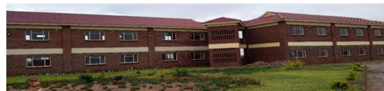
MARY WARD HIGH SCHOOL – seit 2020/2021 1. u 2. Bauabschnitt - Rückansicht