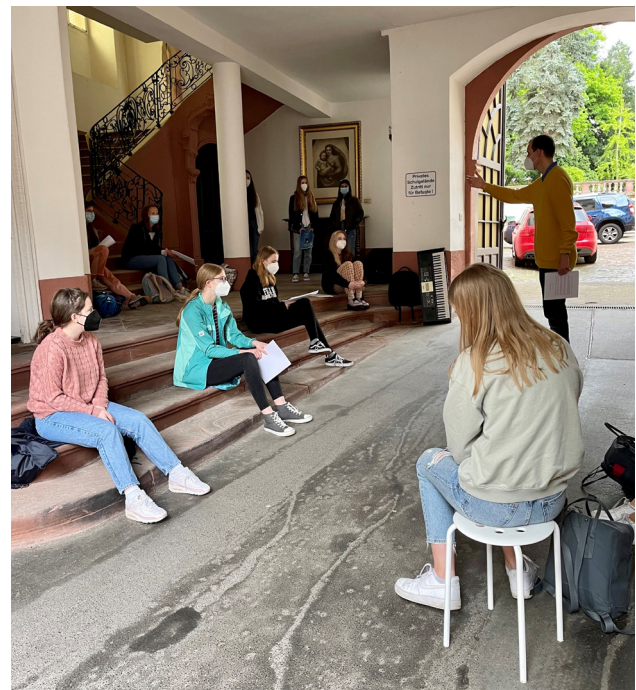
Chorprobe bei Regenwetter