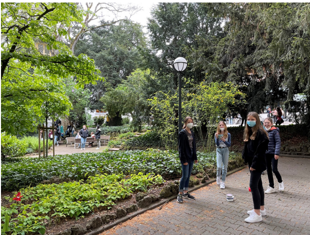
Pause im Garten