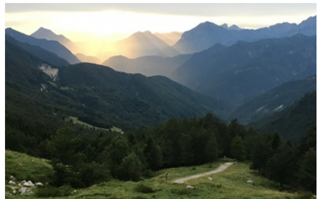
Bergwelt im Friaul

C. Herrlich, Schulpfarrer Maria Ward-Schule MWS ■